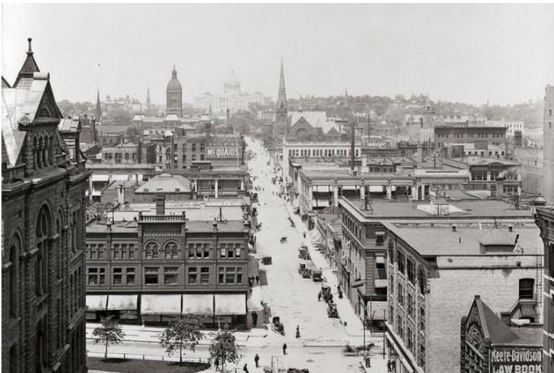
Saint Paul var ett populärt mål för många svenska utvandrare.

I både landsbygds- och stadskolonierna var det vanligt att ett område eller ett kvarter blev i princip "helsvenskt". I Chicago kallades en sådan stadsdel "Andersonville", medan ett område i Saint Paul var känt som "Swede Hollow".