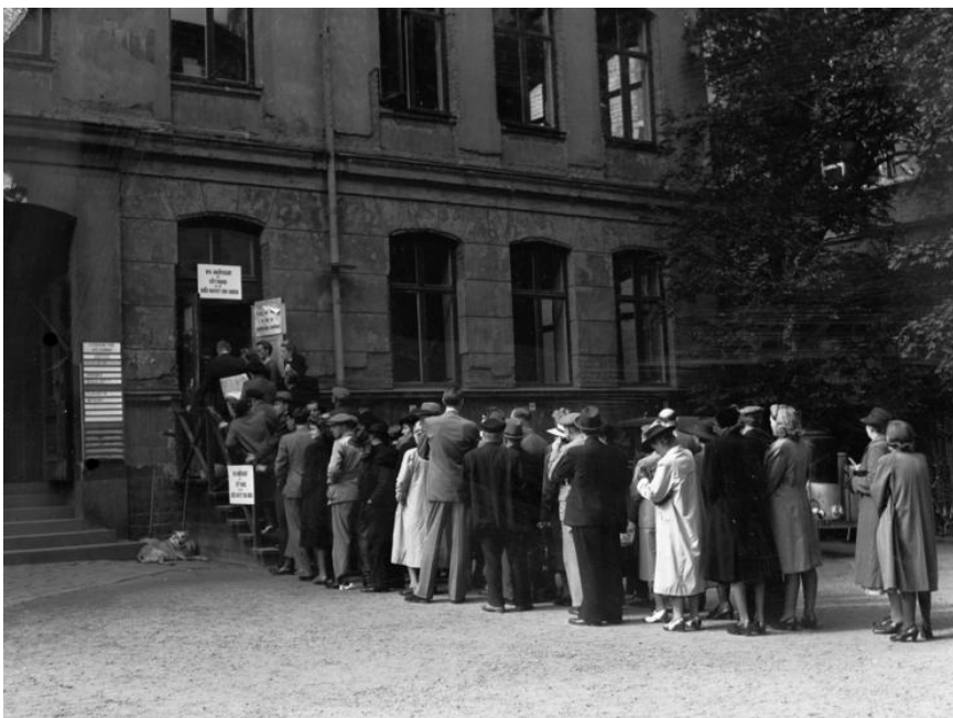
Ransoneringskö, Malmö 1943

Ransoning är begränsad distribution av vissa varor, där varje kund får en bestämd ranson . Ransoning införs ofta under krigstid.