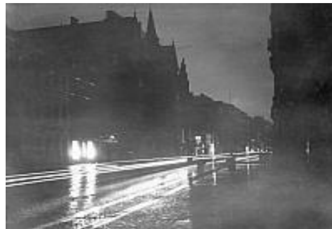
Andra världskriget Sverige Skåne Malmö 1941. Mörkläggning i Malmö. Östergatan i Malmö kl 17,58 på lördagskvällen - total mörkläggning kl 18.00.