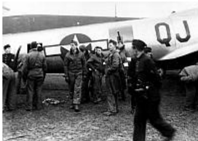
Andra världskriget. Amerikanska flygare och andra besättningsmän utanför ett av de plan som nödlandade på Bulltofta i slutet av andra världskriget.