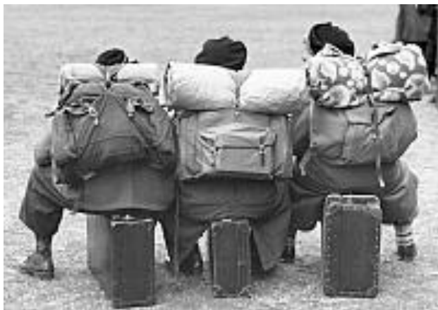
Andra världskriget i Skåne Malmö jan 1940. Skolbarn vid evakueringen evakueringsprov evakueringsövning vid Malmö skolor.